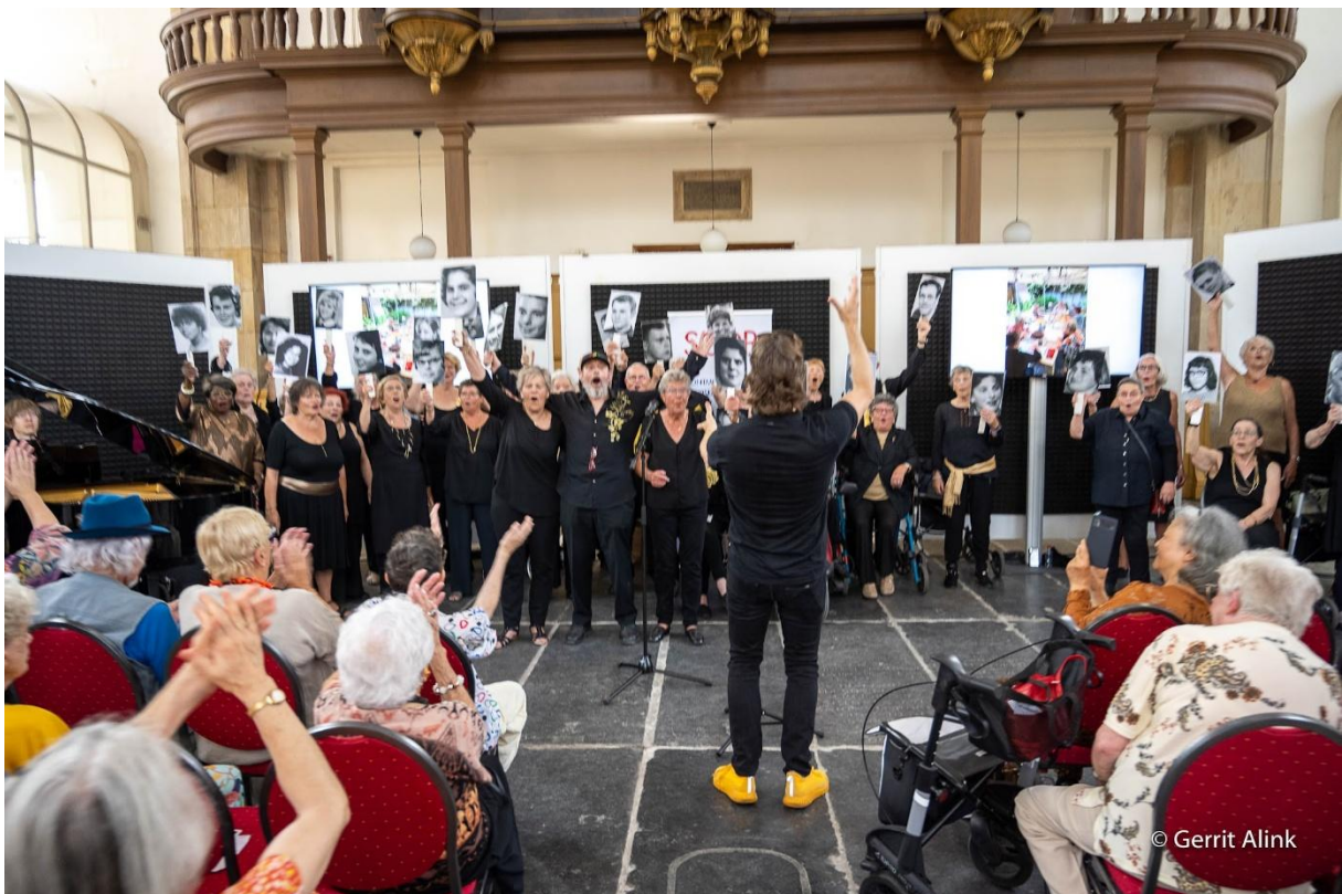
Zondagmiddag 10 september Oosterkerk. SOOP, Stichting Ontmoetingscentrum voor Ouderen in de Plantage-Weesperbuurt viert haar 25-jarig jubileum